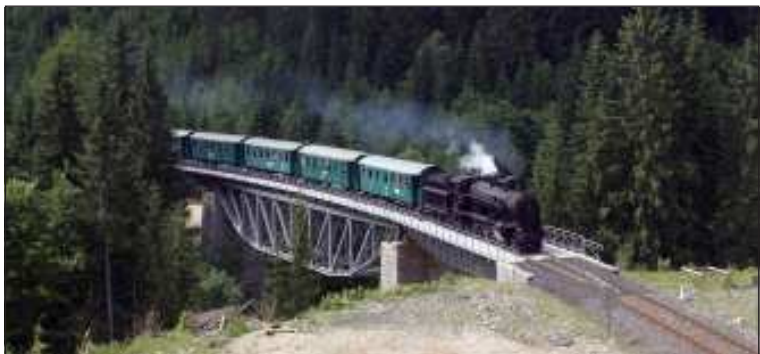
Parní lokomotiva 354.7152 „Sedma“ se soupravou vozů Ce projíždí po mostě přes údolí Jizersy mezi Kořenovem a Harrachovem.

Tuto zajímavou oslavu, za účasti stovky pamí lokomotiv, si na rozhraní Krkonoš a Jizerských hor nenechali ujít příznivci železnice a za dobře připravený program patří organizátorům určitě velký dík. Vít Mareš