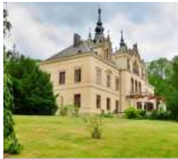
Zámek ve Velkém Březně si nechal vystavět v letech 1842–45 nejvyšší purkrabí Českého království, Karel hrabě Chotek z Chotkova a Woinína.

nout“ na 5 km vzdálenou Bukovou horu (683 m) s 217 metrů vysokou věží televizního vysílače. Ve vrátnici je pak možno získat razítko KČT. Ze zdejší „Humboldtovy vyhlídky“ na vrcholovém skalisku jsou daleké rozhledy do krajiny. Po červené turistické značce se musíme poté vrátit stejnou cestou do Zubnic. Starý motoráček nás odveze zpět.