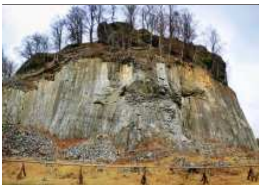
Nad obcí Liska se nachází Zlatý vrch (657 m n. m.) – přírodní památka. Obdivovat zde můžeme až 30 metrů vysoké čedičové sloupky. Při troše štěstí zahlédneme mezi skalami i plaché kamzíky.