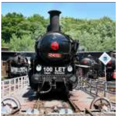
Na zdejší točně se předvedl i letošní jubilat, vršovický „Čtyřkolák“ 434.2186.

A nám opět nezbývá, nežli všem organizátorům poděkovat. A. K. Kýzl