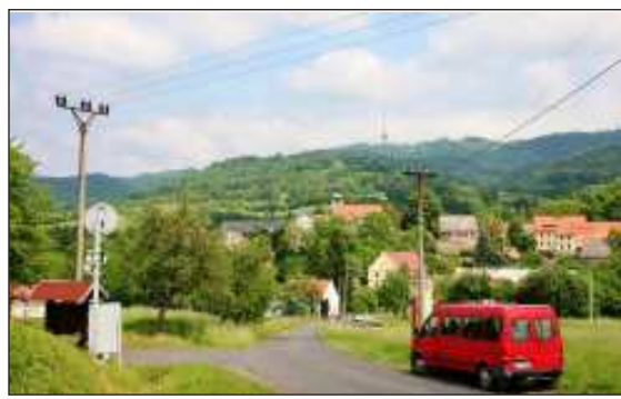
Pohled na Zubrnice s Bukovou horou v pozadí. V obci se nachází nejmladší muzeum lidové architektury v Čechách.