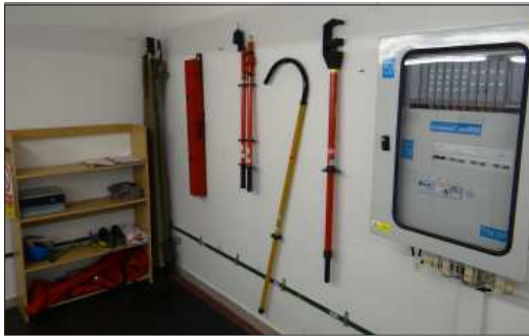
Uzemňovací tyče, ochranné obleky, obuv a helmy patří k základnímu vybavení elektromontérů při práci na elektrických zařízeních.