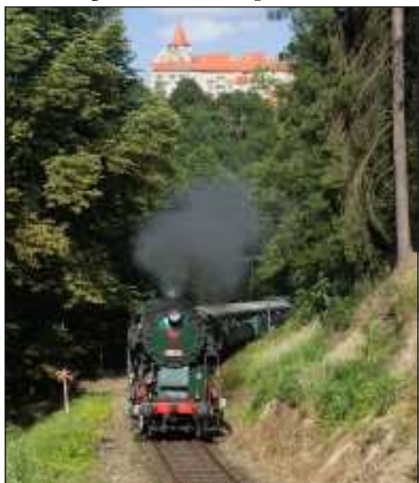
Parní vlak s lokomotivou 464.202 „Rosňa“ z Nedvědice do Žďáru nad Sázavou projíždí po trati 251 mezi stanicí Nedvědice a zastávkou Věžná pod hradem Pernštejn.

Veřejnost si užila dva sváteční dny se železničními nostalgii v nádherné přírodní scénérii sluncem prozářené Vysočiny. Vít Mareš