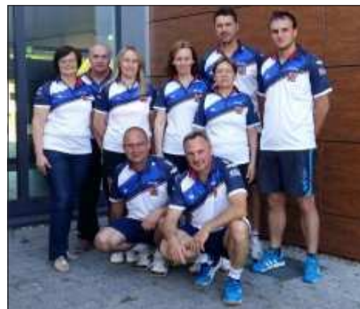
Reprezentanti ČR ve stolním tenisu.

Mistrovství probíhalo podle nových pravidel USIC a tomu odpovídalo výrazné navýšení počtu zápasů. Proti tomuto komplikovanému systému byla vznesena připomínka od švýcarské reprezentace, kterou jsme podpořili. Přesto jsme ve sportovním klání dosáhli velice dobrého umístění.