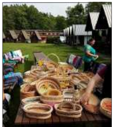
Část výrobků účastníků semináře.