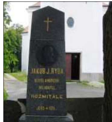
Hrob Jakuba Jana Ryby ve Starém Rožmitále.

Rožmitále byl v roce 1978 StB zbvzen státního souhlasu pro duchovní činnost pozdější pražský arcibiskup Miloslav kardinál Vlk (1932–2017). V Rožmitále je ještě renesanční zámek,