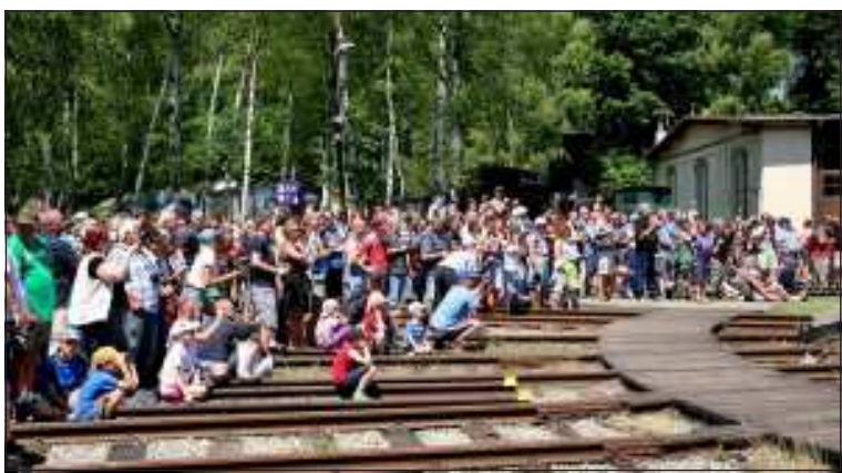
Zcela zaplněné prostranství před točnou svědčilo o velkém zájmu „obecenstva“ o přehlídku parních lokomotiv.