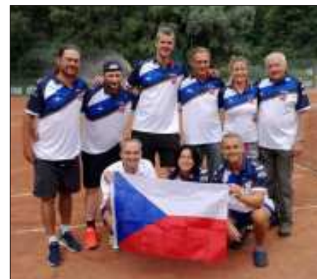
Úspěšní čeští tenisté.