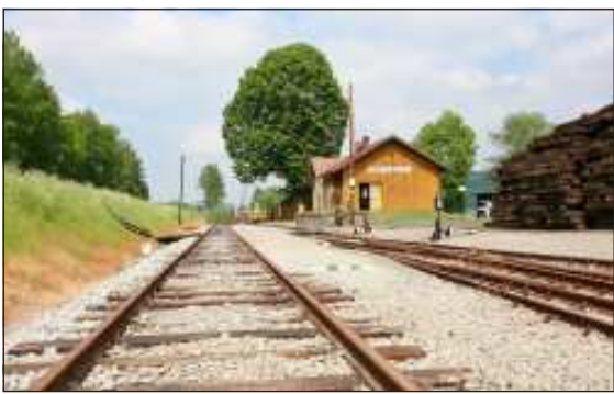
Na nádraží v Zubrnici čeká na výletníky malá železniční expozice.