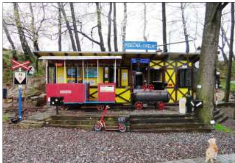
Nádražko Písečná - Cihelna slouží především dětem.