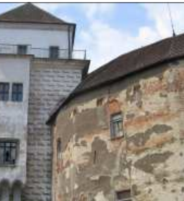
25 let nedokončená oprava zámku v Rožmitále, vizitka společnosti americko-slovenské společnosti Trinitý.

Za mé návštěvy Rožmitálu 21. 6. chyběly v prostoru pro cestující vývěsky odjezdů vlaků, nástupiště u budovy bylo zavaleno hroučícími se obklady a omítkou, budova je našťásti ještě obydlena. Ale jako výkladní skříň města a turistického centra moc nevypadá. V Rožmitálu je navíc vedle Podbrdského muzea ještě volně přístupné muzeum cvokařů – tradiční ruční výroby cvočků–hřebíků, a to i hřebů do dřevěných pražec. Muzeum se nachází v Aleji Johany z Rožmitálu (česká královna, manželka krále Jiříka z Poděbrad) při cestě do Starého Rožmitálu, ten je význačný zase J. J. Rybou, který zde prvně uvedl „Českou mši vánoční“; v roce 1815 spáchal sebevraždu. V kostele ve Starém