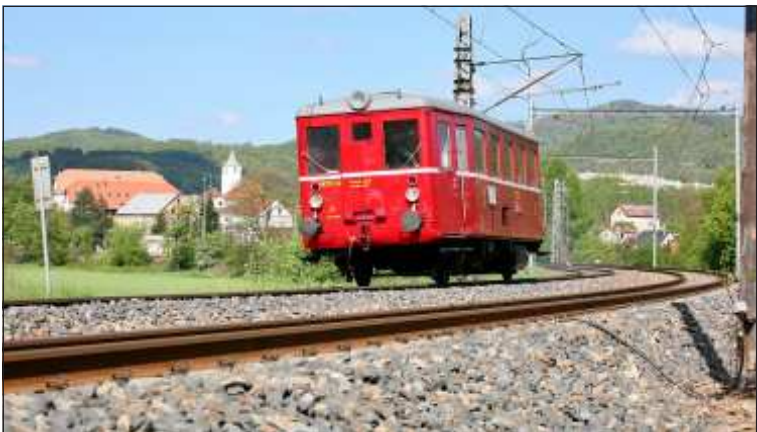
Do Zubrnice se můžeme svést z Ústí nad Labem-Střekova „Zubrnickým motoráčkem“. Na fotografii je vláček zachycen u Valtířova.

V obci je možné navštívit také zdejší známé muzeum lidové architektury. Ten, kdo si oblíbil výšlap na kopečky a rád se kochá dalekými výhledy do krajiny, může si ze Zubnic „vyběh-