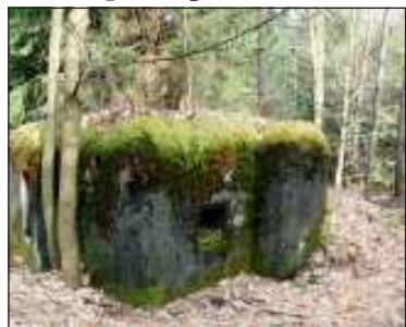
Většina pevnůstek je dnes ukrytá v lesích, porostlá mechem a dokonale splyvajících s okolím.

Hluboké lesy Lužických hor ukrývají spoustu malých betonových pevnůstek, které byly součástí obranných linií, budovaných ve druhé polovině třicátých let minulého století k obraně republiky, především před fašistickým Německem. Tyto tzv. „řopíky“ odvodily svůj název od Reditelství opevnovacích prací a tvořily základní prvek pevnostních linií. Jejich osádku tvořilo zpravidla sedm mužů a objekty byly situovány tak, aby se navzájem kryly palbou. Obvykle byly budovány ve dvou sledech. V letech 1935–38 se podařilo vybudovat 10 012 objektů tohoto lehkého typu (z plánovaného počtu 16 000). Během mobilizace v roce 1938 byla většina pevnůstek vyzbrojena, obsazena posádkou a připravena k obraně vlasti. Jak to nakonec všechno dopadlo, známe z učebnic dějepisu. A tak stovky betonových bunkrů (nejen) ve zdejších lesích zůstaly po dlouhá desetiletí němými svědky tehdejšího odhodlání mladé republiky a jejich obránců hájit svoji svobodu.