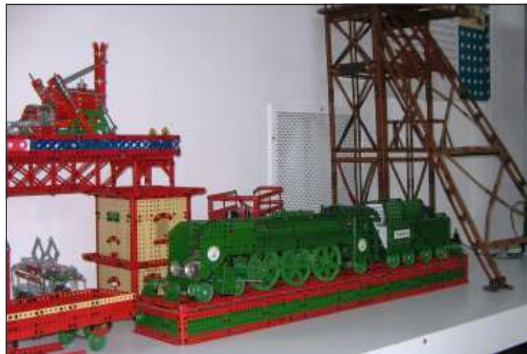
Výstava modelů Merkur v Podbrdském muzeu ( http://www.podbrdskemuzeum.cz/vystavy/ ) - „Mikádo“, 387,0.