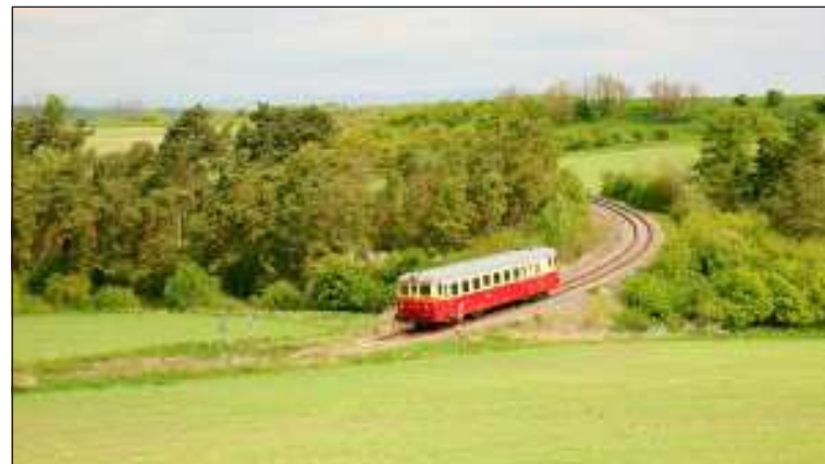
Podřípský motoráček projíždí dne 8. 5. krajinou u železniční zastávky Mšené Lázně. Kdyby byly do zdejších lázní vypravovány přímé vlaky až z Prahy.

Tak nám nezbývá, nežli popřát všem turistům a cestovatelům na výletech slunečné počasí, spoustu hezkých zážitků a příjemné cestování po našem kraji. A. K. Kýzl