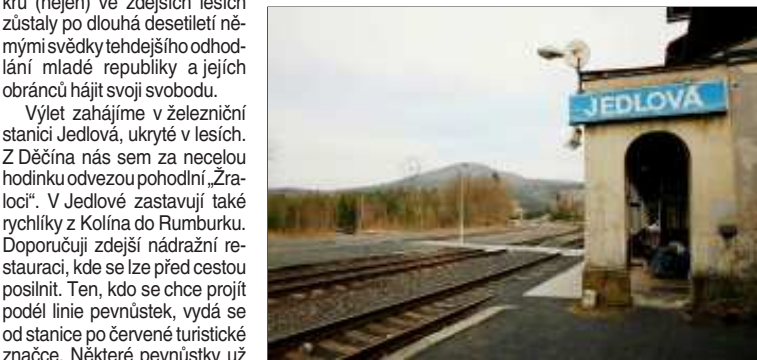
Výlet zahájíme v železniční stanici Jedlová (SŽDC č. 080,081). V pozadí zdejší dominanta, stejnojmenný vrch Jedlová, 774 m n. m.