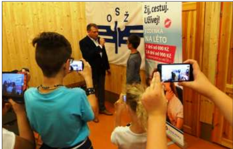
„ Mladí youtuberi při natáčení rozhovoru s generálním ředitelem Českých drah Pavlem Krčkem. “

Toto číslo Obzoru má 8 stran a kromě pravidelných rubrik v něm najdete zajímavosti a tipy pro letní cestování v rubrice Železničářské toulky.