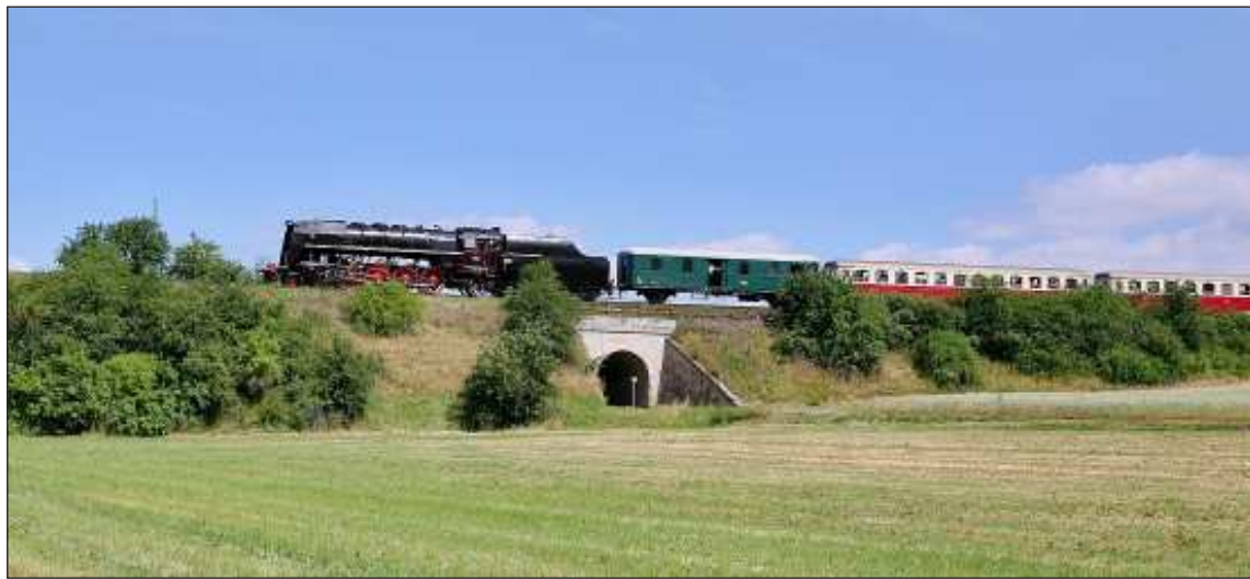
„ Léto je období, kdy se provozuschopné parní lokomotivy mohou zaskvět v hlavní roli při zvláštních jízdách, jako například děčinská „Šlechtična“ Liza, stroj 475.179, v čele zvláštního vlaku z Prahy do Lužné u Rakovníka v sobotu 24. 6. Podrobnosti o Luženském setkání najdete na 4. straně tohoto čísla. “ Snímek u železniční zastávky Kačice pořídil A. K. Kyzl